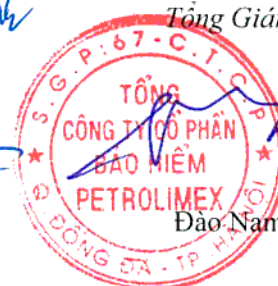
Đào Nam Hải

Các thuyết minh đính kèm là bộ phận hợp thành của báo cáo tài chính hợp nhất giữa niên độ này