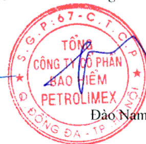
Đào Nam Hải

Các thuyết minh đính kèm là bộ phận hợp thành của báo cáo tài chính hợp nhất giữa niên độ này