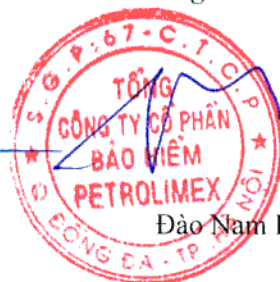
Đào Nam Hải